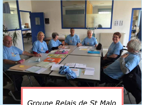
Groupe Relais de St Malo

Enfin, ils sont légion ceux qui s'investissent dans toutes les opérations ressources : braderies, brioches, fête du sourire, paquets cadeaux..., opérations sans lesquelles les activités proposées à nos adhérents en situation de handicap ne seraient plus possibles !