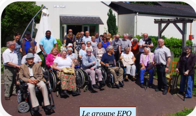
Le groupe EPO

En 2015 je suis élue du conseil départemental APF 35, je participe à la rédaction d'Handizou le journal de la Délégation, à la promotion des legs pour l'APF, et prochainement, je serai un de vos représentants au sein de la Commission Départementale Autonomie des personnes Handicapées pour la défense de vos droits.