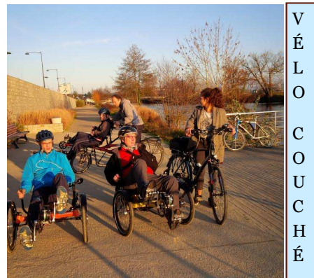
V É L O C O U C H É