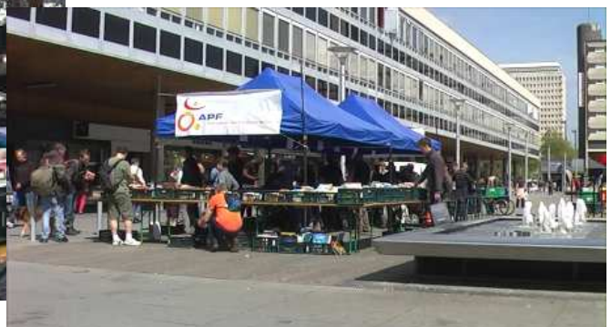
STANDS Installés Dalle du Colombier à RENNES