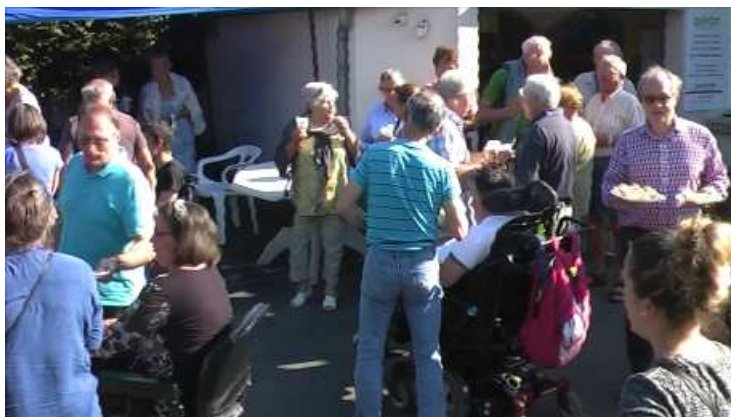
Rencontre conviviale des bénévoles de la Délégation en juin 2017

Sans nos bénévoles, aucune action ressources ne serait possible. Grâce à leur efficacité, leur disponibilité, leur fidélité, leurs qualités d'adaptation..., nous avons pu collecter les fonds nécessaires à l'organisation d'activités et de sorties pour nos adhérents en situation de handicap.