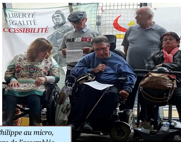
Philippe au micro, lors de l'assemblée départementale 2016

Le Groupe Initiatives intervient également sur le terrain de l'accessibilité : après avoir répondu à un questionnaire qui a permis d'établir un 1er baromètre de l'accessibilité, les communes du département sont contactées par le groupe et une démarche sur place est organisée : la caravane de l'accessibilité : rencontre avec les élus, déambulation dans la commune : visite et évaluation des espaces publics et semi-publics et échanges avec les commerçants notamment sur