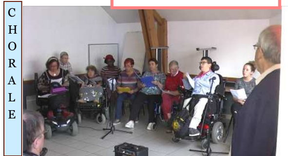
C H O R A L E