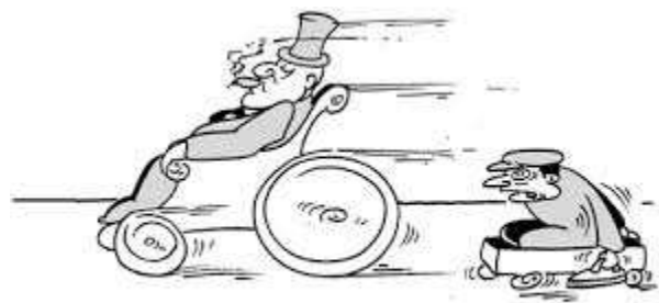
Médecine à deux vitesses

• Développement de l'hospitalisation à domicile, de préférence aux soins en milieu hospitalier quand ce n'est pas nécessaire.