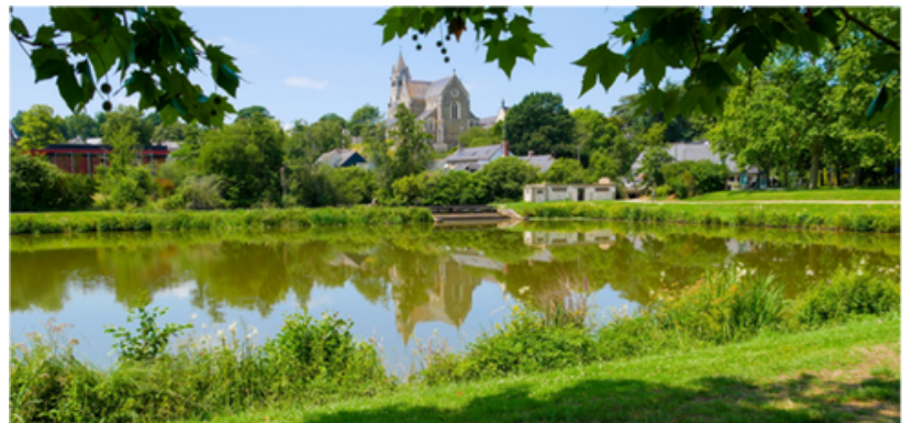
Brigitte vivait à Betton, une ville qu'elle aimait beaucoup, appréciant particulièrement les balades au bord de l'eau