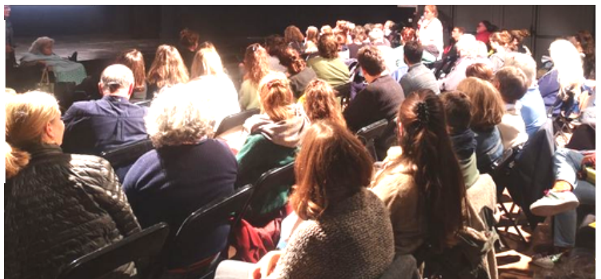
Un nombreux public au ciné-débat "debout les femmes" organisé dans le cadre d'un café citoyen