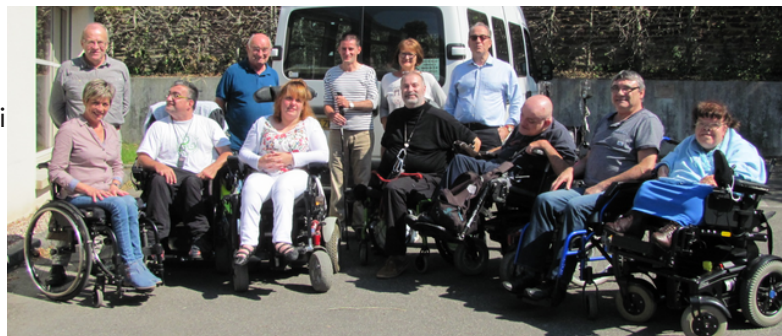
Les membres du CAPFD (Conseil de Département APF 35)