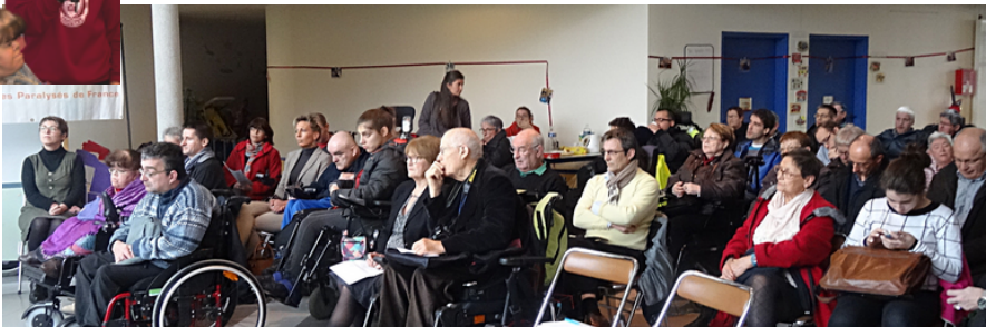
Présente aussi aux assemblées départementales, ici IEM de Chartres de Bretagne

En soutenant APF France handicap, vous permettrez à des milliers de personnes de ne plus être seules face au handicap !