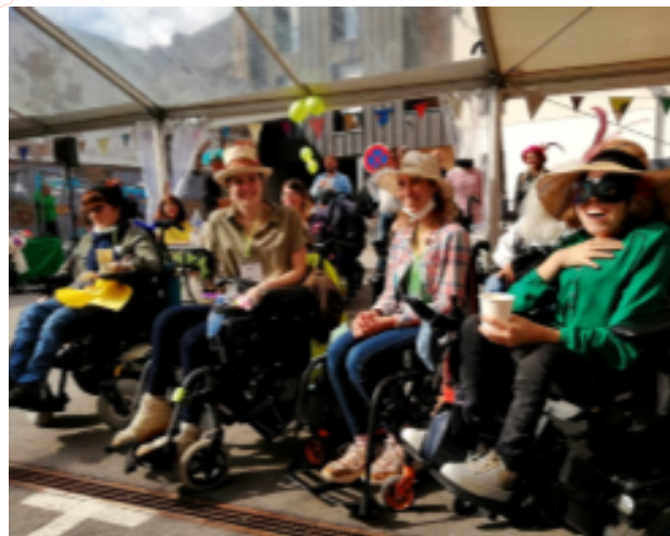
30 ans de l'APEA de Redon

Nous nous retrouvons aussi à l'occasion des Conseils de la Vie Sociale des APEA (Appartements de Préparation et d'Entraînement à l'Autonomie) de Redon.