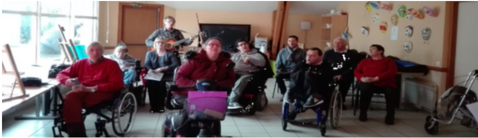
La chorale de la délégation