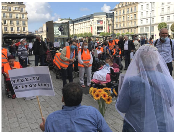
Engagée et toujours présente pour se battre contre les injustices

Elle faisait partie des choristes qui ont égayé la fête des bénévoles à la Délégation en juin 2022