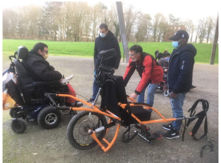
Préparation du transfert dans la joëlette