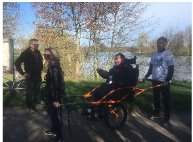
Et voilà, c'est parti !