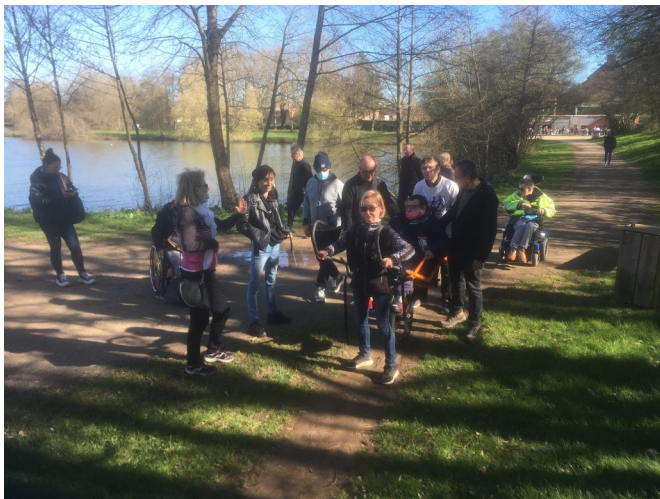
Soleil et bonne humeur aux étangs d'Apigné

Depuis, la joëlette a fait plein d'adeptes, l'objectif étant de faire partager aux valides et non-valides le bonheur de la randonnée.