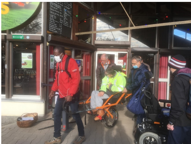
Météo moins agréable mais balade tout aussi sympathique aux Gayeulles